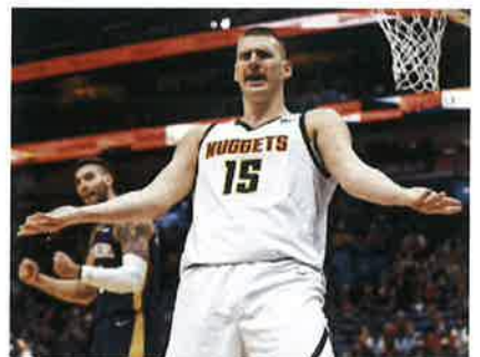
Jokic protesta en un partido entre Nuggets y Pelicans.

La lluvia de dólares ha formado un torrente de 1.800 millones sólo para ocho jugadores. Pero claramente la cifra puede seguir aumentando si James Harden llega a un acuerdo de renovación, como parece, con los Sixers y caen otros 270 millones en cinco años. Serían 2.000 millones de gasto en ocho jugadores. ●