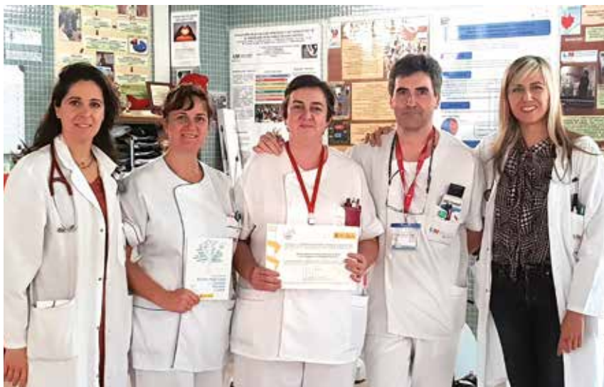
El Consejo Interterritorial del Sistema Nacional de Salud reconoce al equipo de Rehabilitación Cardíaca del Hospital Fundación de Alcorcón por sus buenas prácticas.