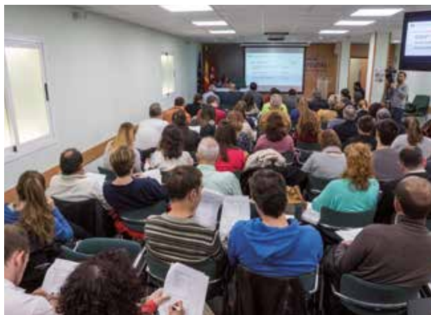
Momento de la Asamblea General Ordinaria de diciembre de 2017.

Primero, se procederá a la designación de dos interventores para firmar el acta