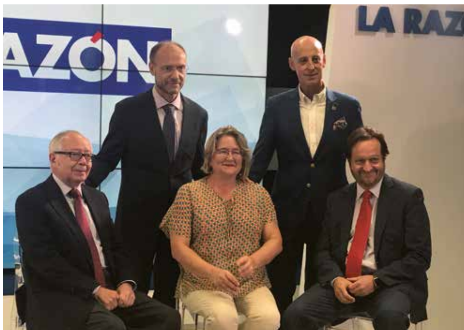
La Razón, en colaboración con el CPFCM, organizó una mesa redonda en la que se abordaron los retos a los que se enfrenta la Fisioterapia, entre otros, la autonomía profesional, las áreas de competencia y los procesos de derivación en la Sanidad Pública.