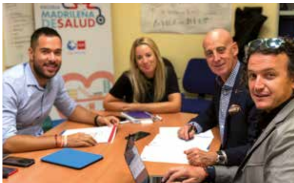
Reunión entre representantes del Colegio y la Viceconsejería de Humanización de la Asistencia Sanitaria de la Comunidad de Madrid.